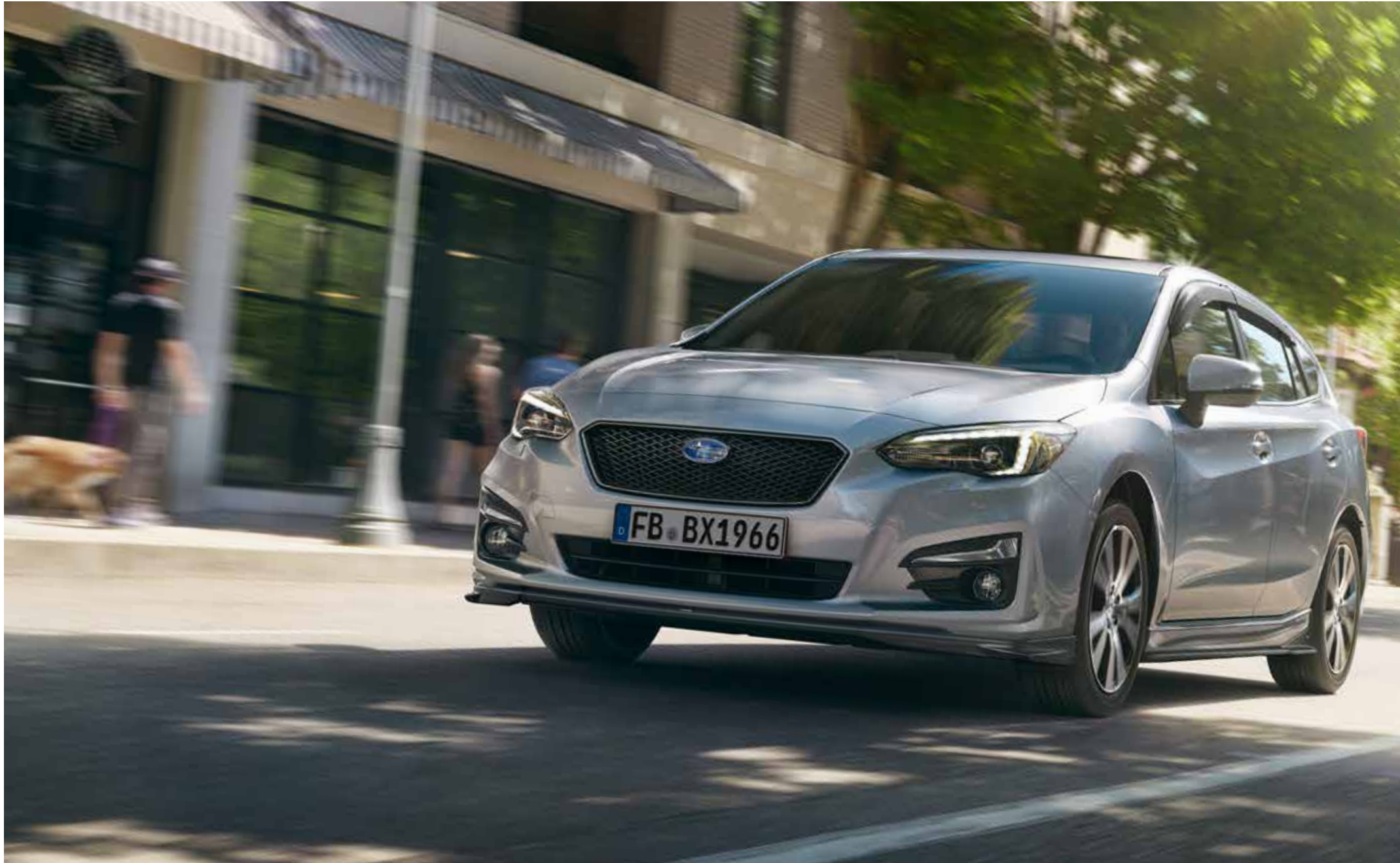
S. 04: Gitterfrontgrill, Seitenwindabweisersatz, STI Frontspoiler-Lippe, STI Seitenspoilersatz.