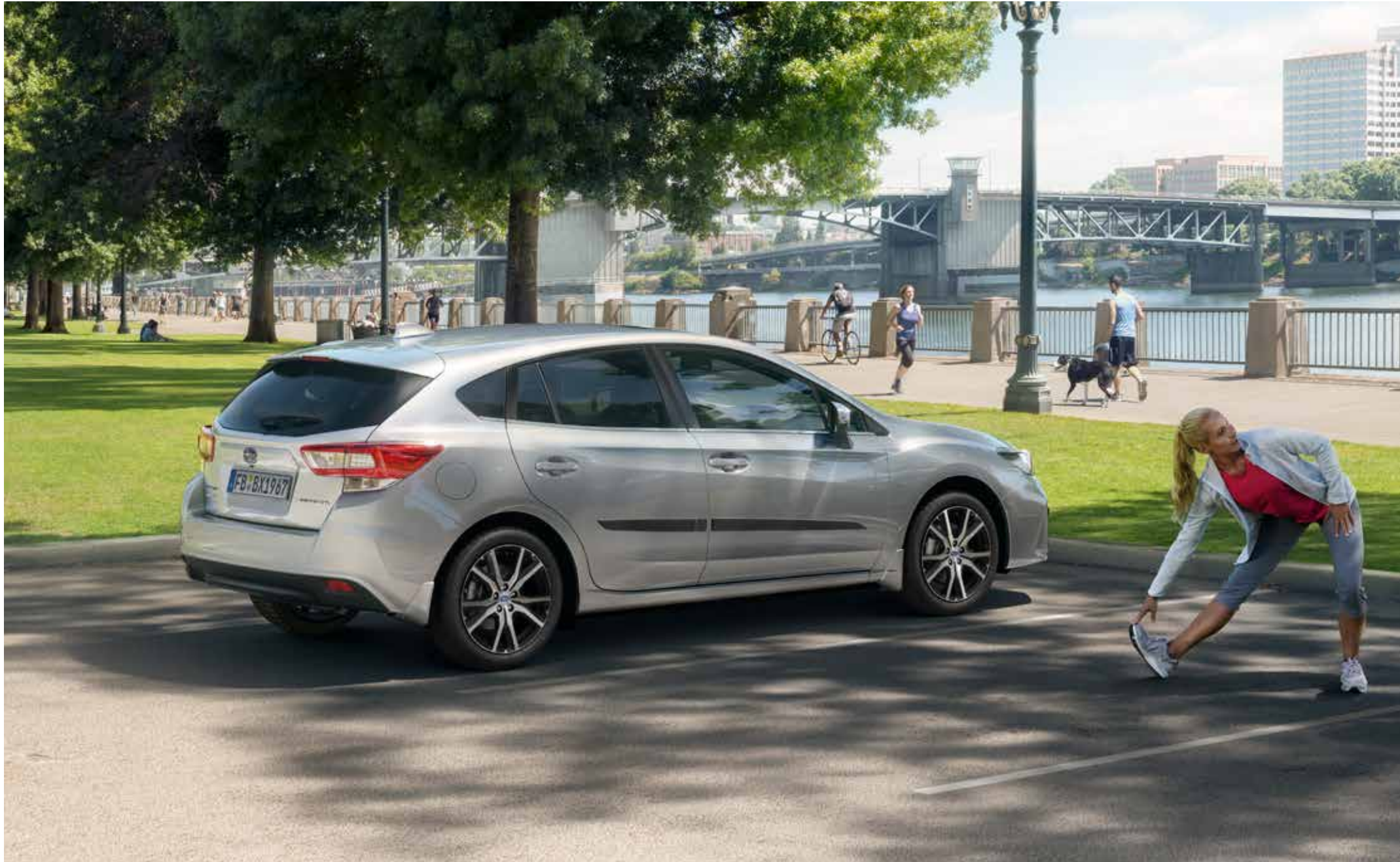
S. 08: Stoßfängerschutzleiste (Edelstahl), Schmutzfängersätze vorne und hinten, Seitenschutzleistensatz Carbonoptik.