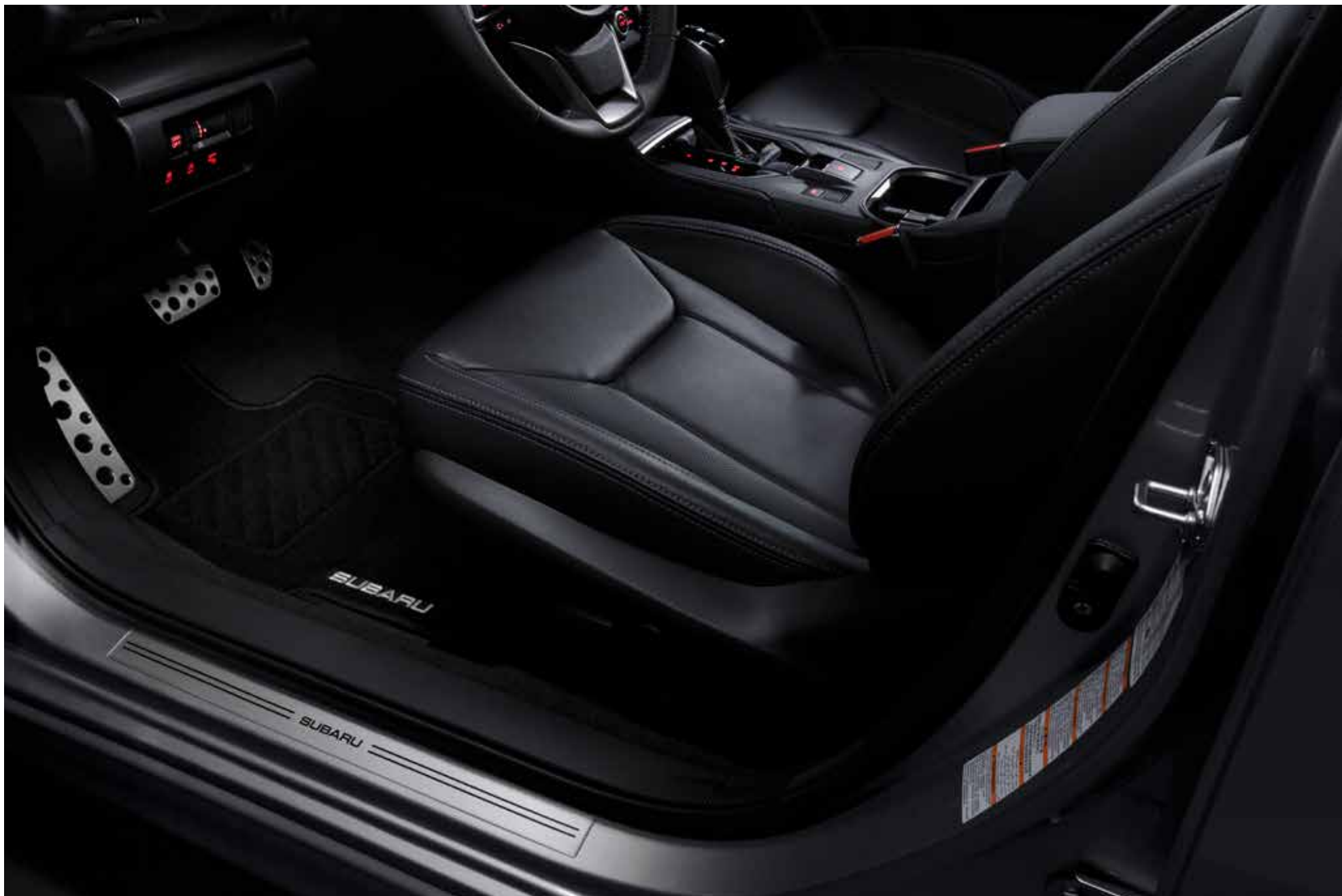
S. 12: Teppichmattensatz Standard, Türeinstiegsleistensatz Kunststoff.