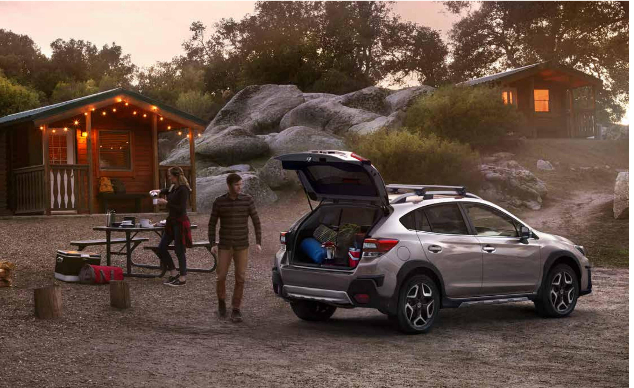
S. 11: Kunststoffheckblende Aluminiumoptik, Stoßfängerschutzleiste (Kunststoff), Stoßfängerschutzdeckensatz, Schmutzfängersätze, Aluminium-Dachgrundträger C-Slot, Kunststoffseitenblendensatz Aluminiumoptik.

★Alle Artikel, die mit diesem Symbol gekennzeichnet sind, können zu Preisvorteilspaketen zusammengefasst werden. Siehe Preisliste auf Seite 22/23 und Rückseite. Die Preise der jeweiligen Artikel entnehmen Sie bitte der Preisliste auf Seite 22/23. Die Preise verstehen sich zuzüglich Montage und eventuell notwendiger Lackierarbeiten sowie TÜV-Kosten.