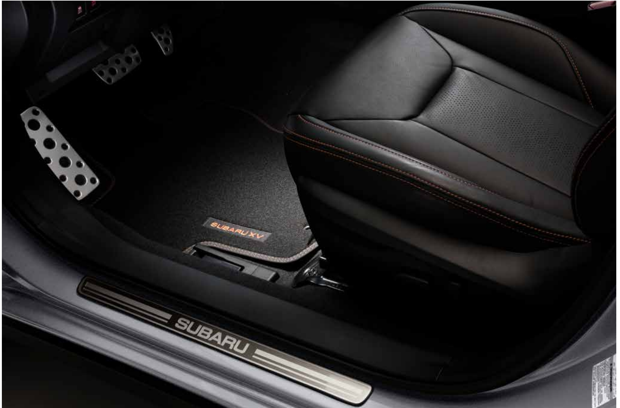
S. 14: Teppichmattensatz vorn und hinten Premium, Türeinstiegsleistensatz Edelstahl.