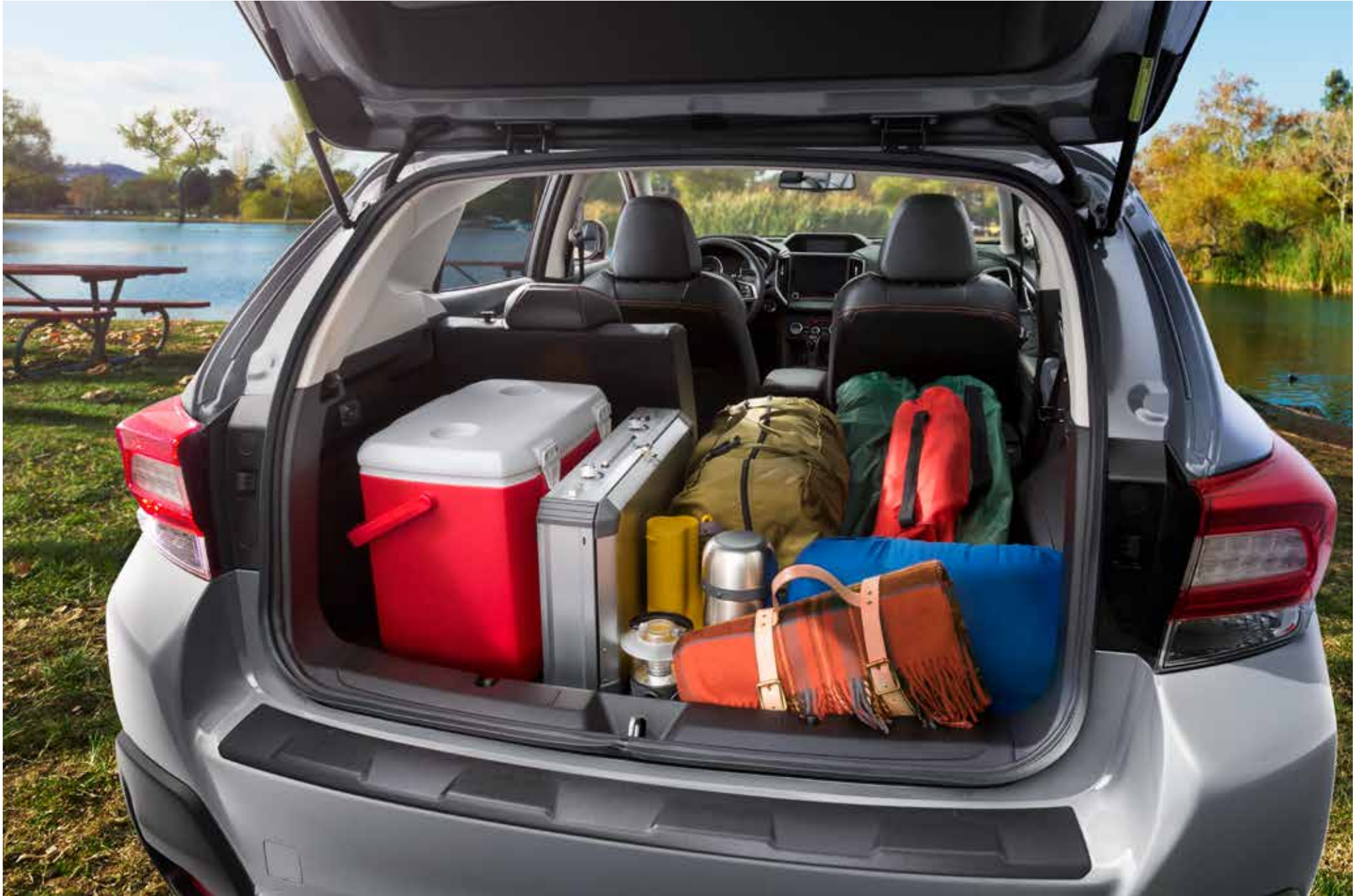
S. 18: Stoßfängerschutzleiste (Kunststoff).