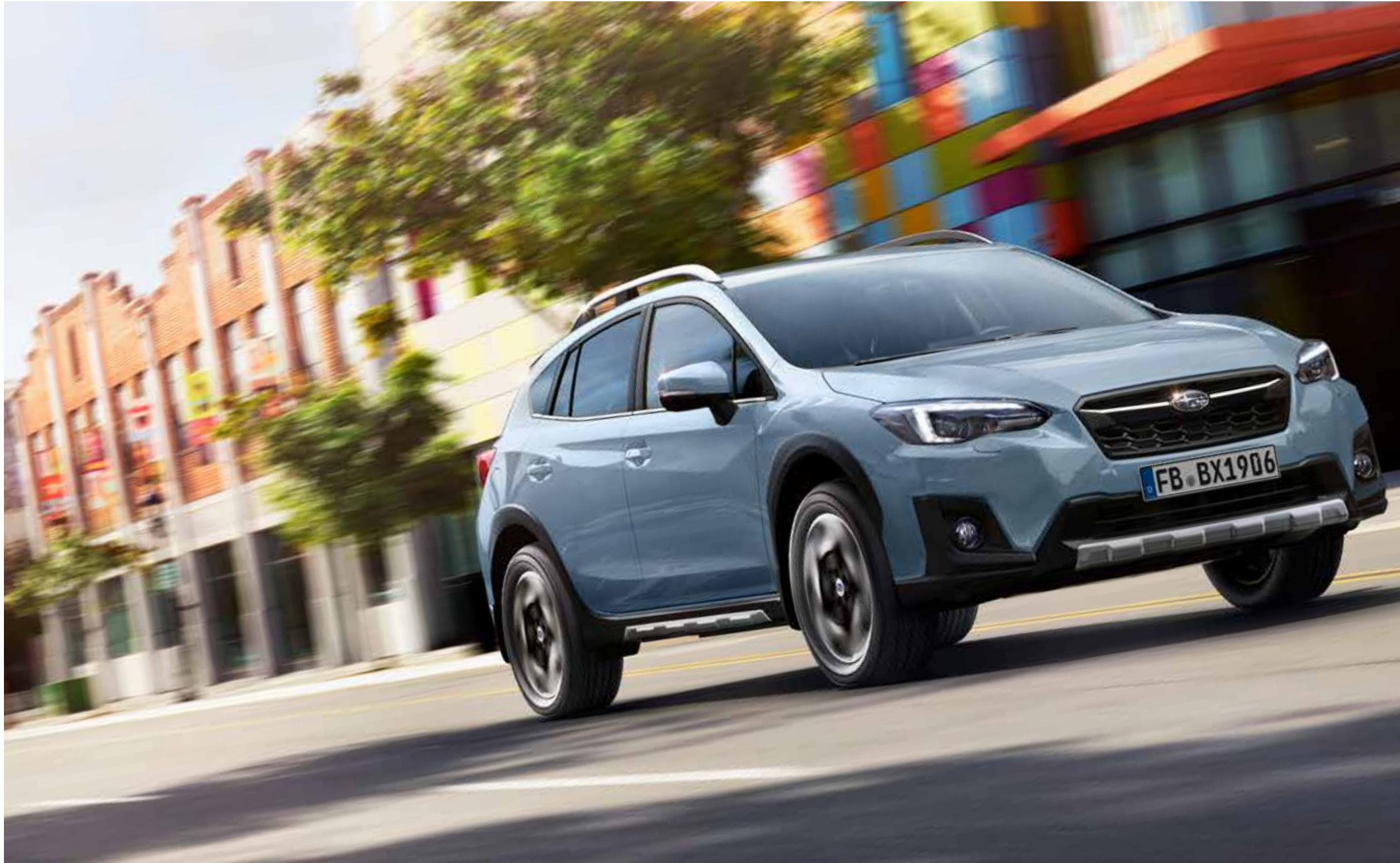
S. 04: Kunststofffrontblende Aluminiumoptik, Kunststoffseitenblendensatz Aluminiumoptik, Schmutzfängersätze.