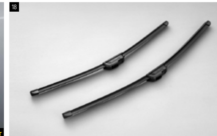
18 Premium Scheibenwischer "Aeroblade" SEBOSG8000 Aerodynamisches Design für bessere Performance. *Set mit 2 Scheibenwischerblättern