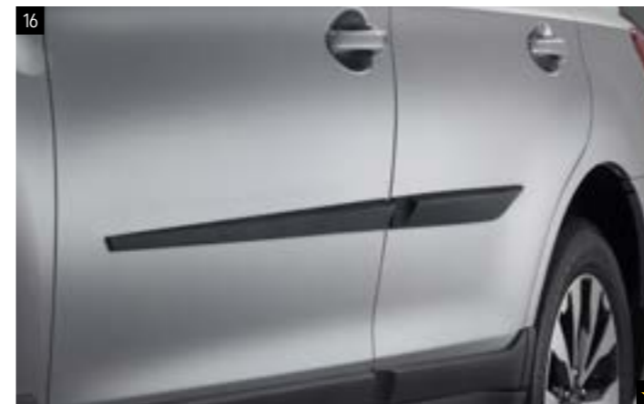
16 Seitenschutzleistensatz J105EAJ103 Ergänzt die Designelemente und schützt die Karosserieseite.