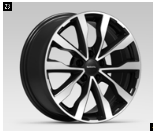
23 Leichtmetallfelge 7,0 x 18", ET 55 1518 Schwarz poliert, 7,0 x 18", ET 55