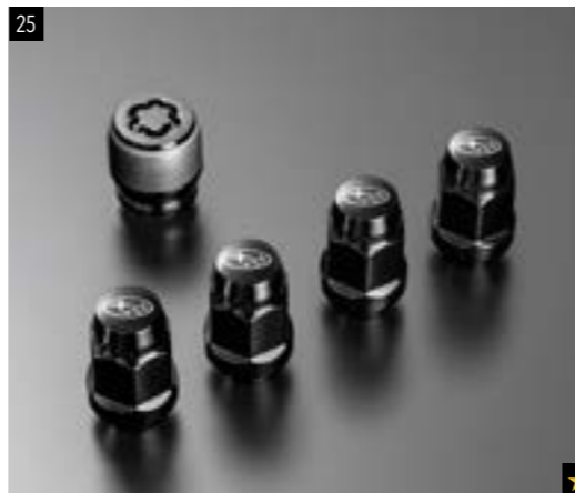
25 Felgenschloss- und Radmutterersatz-Schwarz SEMGYA4000 Diebstahlschutz in speziellem Design für Ihre Felgen und Reifen. Das Kit besteht aus 16 schwarzen Radmuttern mit Subaru Logo, vier Felgenschlüssern und einem speziellen Schraubenschlüssel.