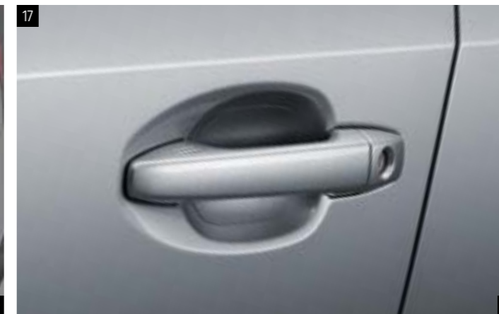
17 Griffmuldenschutzfolie SEZNF22000 Transparente Folie zum Schutz der Griffmulden vor Kratzern. *Set mit 2 Folien