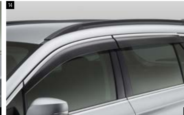
14 Seitenwindabweisersatz F0010AL300 Verhindert bei schlechtem Wetter das Eindringen von Regen/Schnee beim Fahren mit leicht geöffnetem Fenster.