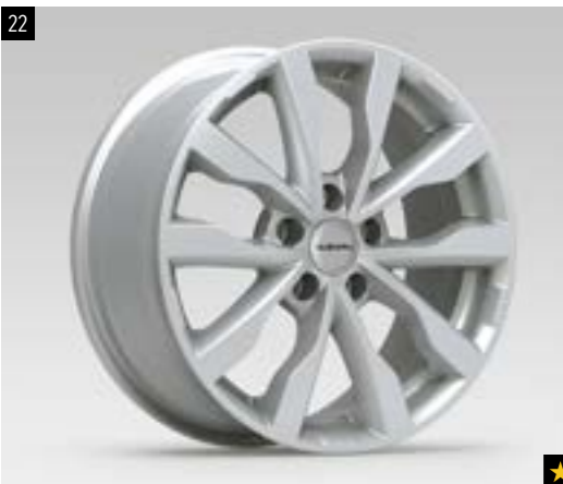
22 Leichtmetallfelge 7,0 x 17", ET 55 1517 Silber, 7,0 x 17", ET 55