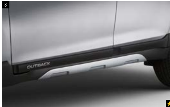
8 Kunststoffseitenblendensatz Aluminiumoptik E265EAL000 Zum Schutz des Fahrzeugs vor Steinschlag. Verstärkt die Offroad-Optik.