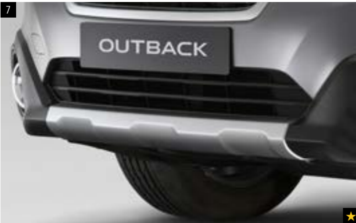
7 Kunststofffrontblende Aluminiumoptik SEFHAL3000 Zum Schutz des Fahrzeugs vor Steinschlag. Verstärkt die Offroad-Optik.