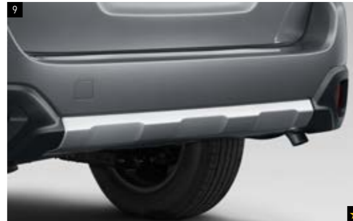
9 Kunststoffheckblende Aluminiumoptik SEFHAL3100 Zum Schutz des Fahrzeugs vor Steinschlag. Verstärkt die Offroad-Optik.