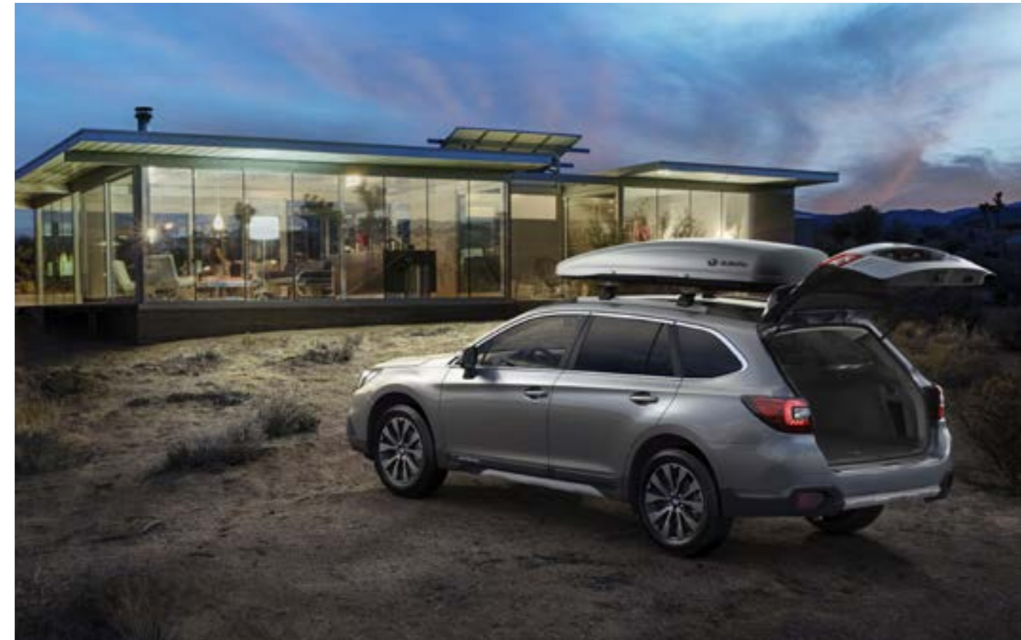
S. 13: Kunststoffseitenblendensatz Aluminiumoptik, Kunststoffheckblende Aluminiumoptik, Aluminium-Dachgrundträger C-Slot, Dachbox.

52 Laderaumtrenngitter F555EAL000 Trennt den Laderaum vom Insassenbereich. Besonders für den Transport von Hunden geeignet.