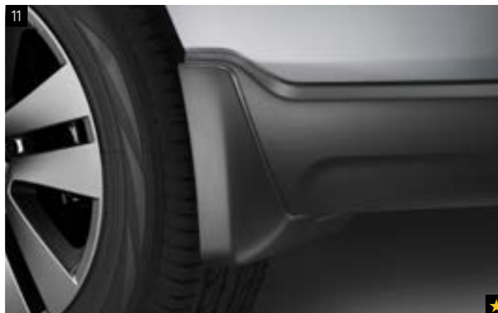
11 Schmutzfängersatz hinten J101CAL104 Verhindert, dass Matsch, Schnee, Teer, Steine usw. an die Karosserie kommen.