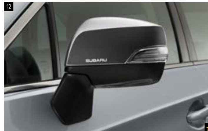
12 Dekorfolien für Außenspiegel Schwarz SEBDFJ3000 Verleiht den Außenspiegeln einen ganz neuen Look.