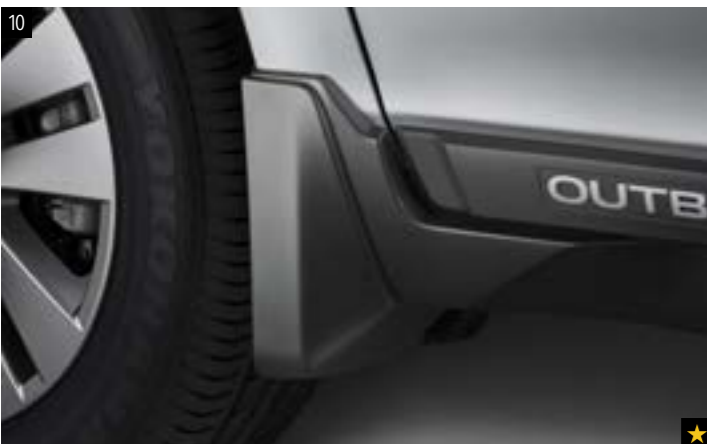
10 Schmutzfängersatz vorne J101CAL101 Verhindert, dass Matsch, Schnee, Teer, Steine usw. an die Karosserie kommen.