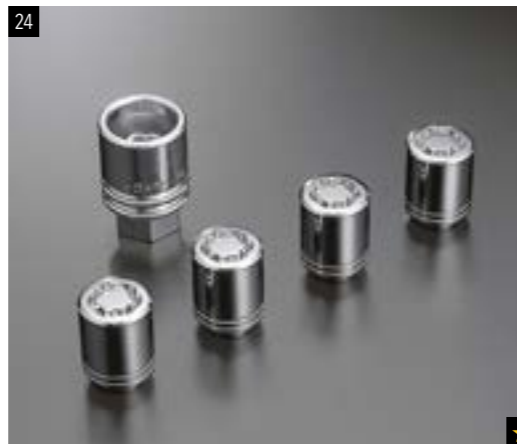
24 Felgenschlosssatz B327EYA000 Diebstahlschutz für Ihre Felgen und Reifen. Besonderer Schlüssel notwendig.