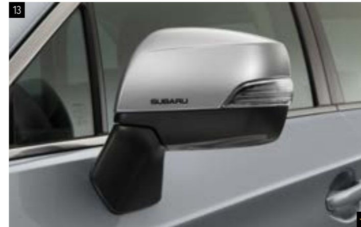
13 Dekorfolien für Außenspiegel Silber SEBDFJ3010 Verleiht den Außenspiegeln einen ganz neuen Look.