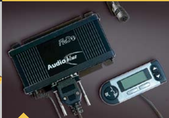
Freisprecheinrichtung BlueThooth zum Festeinbau Artikel-Nr. 86120-87350-100