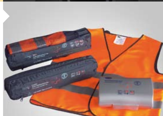
Warnweste Artikel-Nr. 99910-30015-000