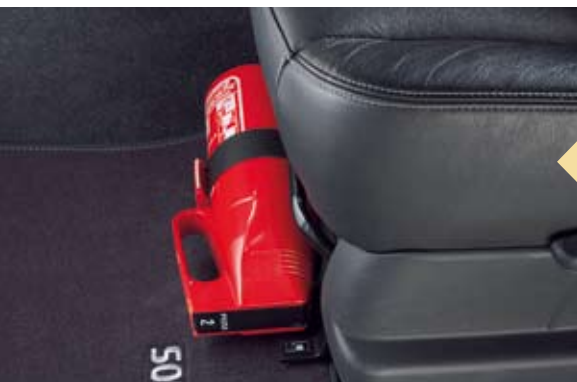
Feuerlöscher mit Halterung, 1 kg Füllung Artikel-Nr. 99910-30040