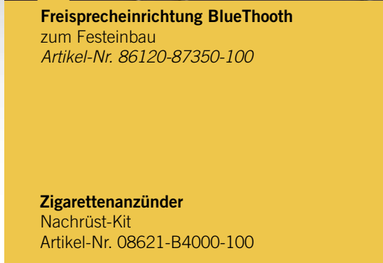
Zigarettenanzünder Nachrüst-Kit Artikel-Nr. 08621-B4000-100