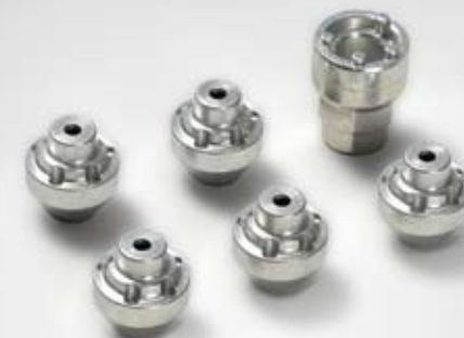
Radsicherung für Leichtmetallräder abschließbar Artikel-Nr. 42612-87601-000