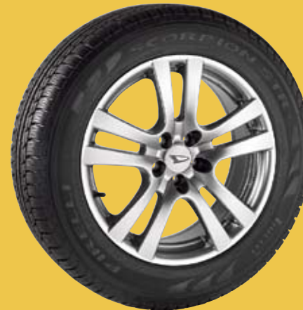
Leichtmetallrad 7 x 16" * für Serienbereifung. Chromglanzlackierung. Artikel-Nr. 42611-08216