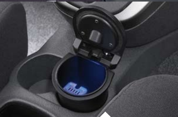
Aschenbecher Solarbetrieben, schwarz, blaue Beleuchtung Artikel-Nr. 08623-B2001