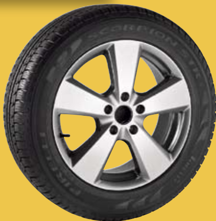
Leichtmetallrad 7 x 17" * Chromglanzlackierung. Mit Bereifung 235/55 R17 Artikel-Nr. 42611-18218