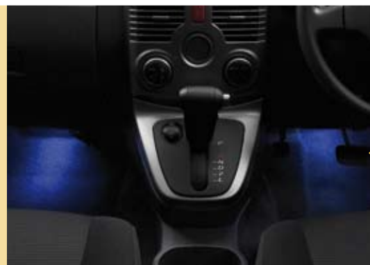
Fußraumbeleuchtung 2-teiliges Set, blaue Beleuchtung, inkl. Verkabelung Artikel-Nr. 08520-B4000-100