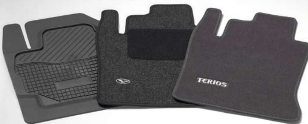
Fußmattensatz Gummi 4-teilig Artikel-Nr. 58500-83215-110