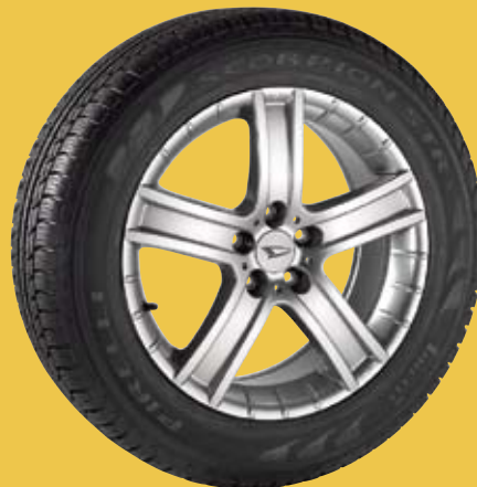
Leichtmetallrad 7,5 x 17" * Chromglanzlackierung. Mit Bereifung 235/55 R17 Artikel-Nr. 42611-18217